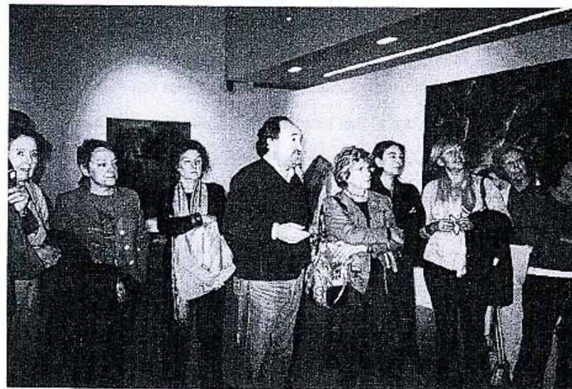
VISITAS Y VIAJES