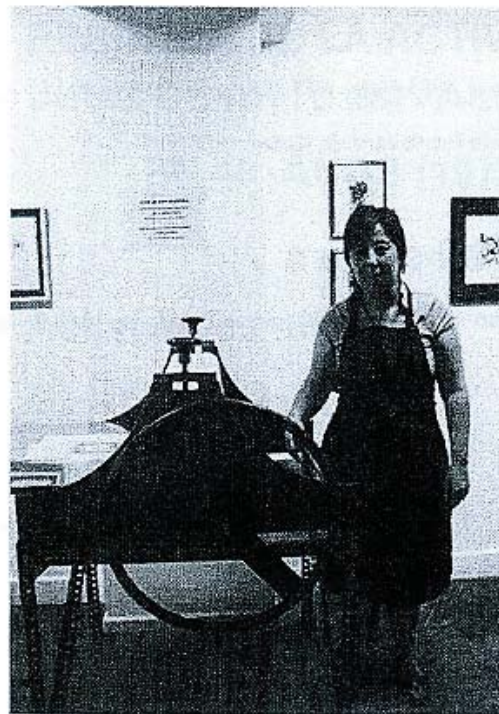
Exposición de óleo y grabado en la Sala Kutxa Boulevard en junio de 2012

Julio - Exposición de Esmaltes sobre cobre en la Sdad. Fotográfica.