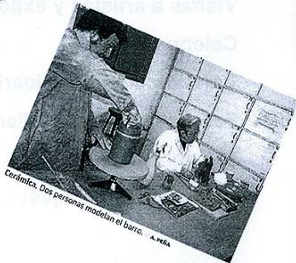
Cerámica. Dos personas modelan el barro.

La Asociación organiza más de 30 actividades al año relacionadas con el arte