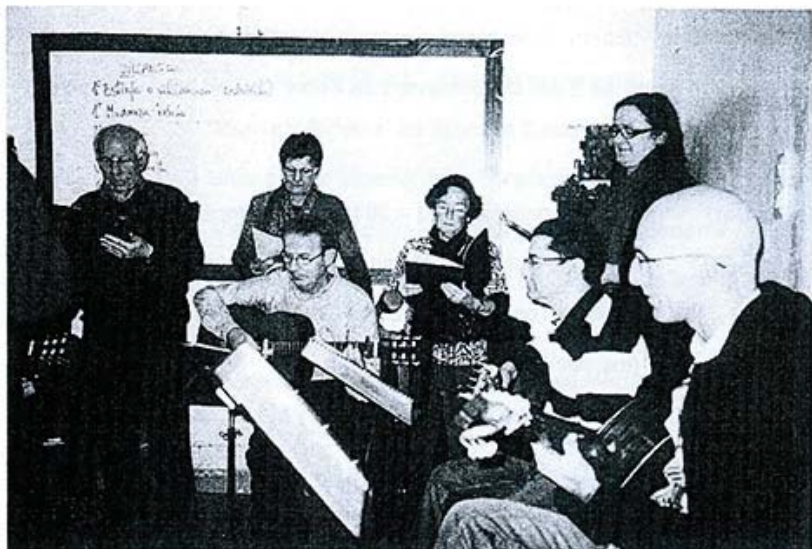
Concierto del grupo de guitarras y colaboración con Donostia 2016